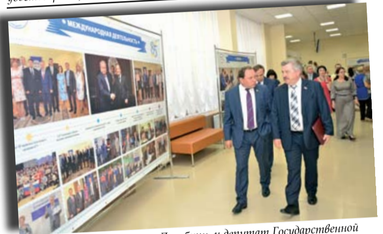
Председатель ЗС РО Виктор Дерябкин и депутат Государственной Думы Виктор Водолацкий ознакомились с достижениями ДГТУ

Выпускниками ДГТУ являются четыре депутата Законодательного Собрания Ростовской области V созыва, члены фракции «ЕДИНАЯ РОССИЯ» – ЕВГЕНИЙ ШЕПЕЛЕВ (председатель комитета по строительству), МАКСИМ ЩАБЛЫКИН (председатель комитета по местному самоуправлению), ВЛАДИМИР САКЕЛЛАРИУС и СЕРГЕЙ СУХОВЕНКО