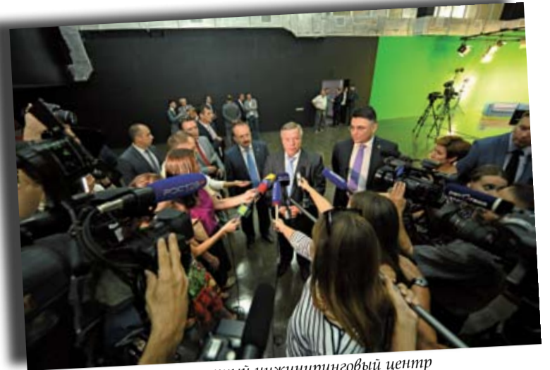
Новый медиакоммуникационный инжиниринговый центр «Медиапарк Южный Регион – ДГТУ»